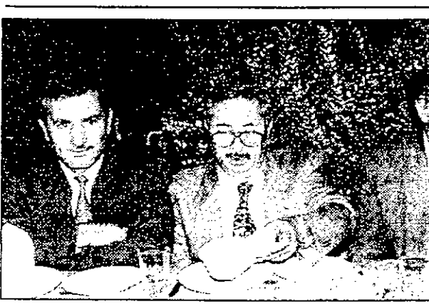
مندوب وزير السياحة يتوسط التاجر وعكاش